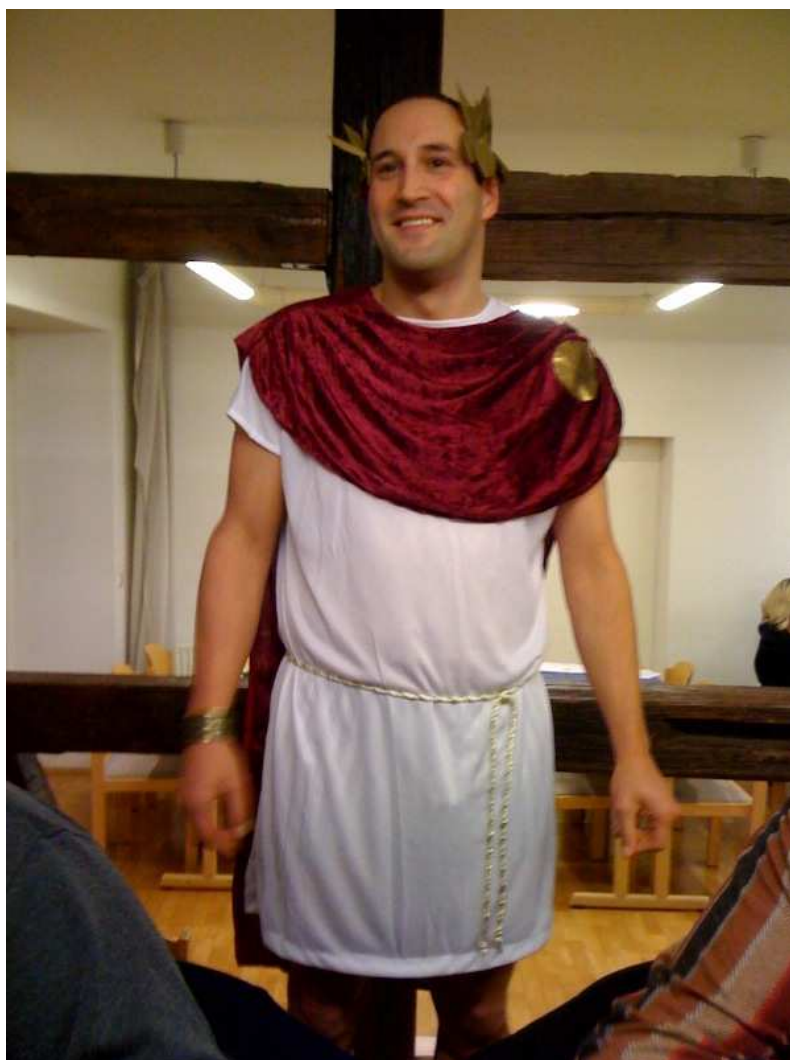
Julius Caesar alias ‚Schlumbergus‘

Damit legten die Besucher fest, ob sie dem gallischen Lager um Asterix oder dem römischen Lager um Julius Caesar alias ‚Schlumbergus‘ angehören wollten. Die Gallier waren deutlich in der Überzahl.